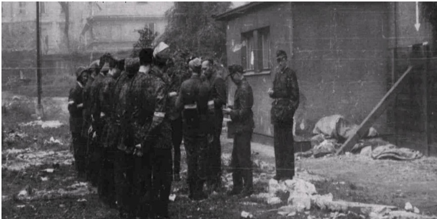
Odprawa batalionu „Chrobry I” na tyłach budynku szkoły przy ul. Barokowej 7 – miejsca pobytu Delegatury Rządu na Kraj i dowódcy AK na Starym Mieście, 13 sierpnia 1944 r. Fot. z zasobu IPN

https://przystanekhistoria.pl/pa2/tematy/zbrodnie-niemieckie/72854,Delegatura-Rzadu-na-Kraj-w-czasie-Powstania-Warszawskiego.html