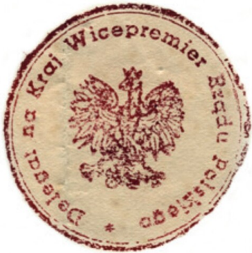
Pieczczę Delegata Rządu na Kraj.

Przed prezydentem miasta, zwanym Delegatem Stołecznym, stanęło wiele zagadnień do rozwiązania. Miasto podzielone zostało na Delegatury Dzielnicowe, zaś te z kolei na Komendantury Blokowe. Utrzymywanie stałego kontaktu z tymi komórkami pozwoliło usuwać szereg bolączek, na jakie była narażona Warszawa.