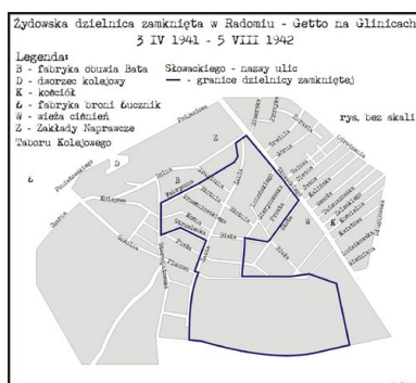
Schemat getta na Glinicach w Radomiu

Latem 1942 r. w stolicy dystryktu, Radomiu, żyło w skrajnie trudnych warunkach materialnych ok. 33 tys. osób narodowości żydowskiej. Od ponad roku przymusowymi miejscami ich zamieszkania były dwie, położone w różnych rejonach miasta, zamknięte dzielnice, określane przez Niemców mianem „getta złożonego”. W tzw. małym getcie znajdującym się w dzielnicy Glinice – odciętej od centrum miasta linią kolejową – wegetowało ok. 8 tys. mężczyzn, kobiet i dzieci z ubogich środowisk robotniczych. Borykali się oni z coraz większą nędzą i terrorem ze strony Niemców.