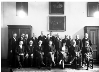
Otwarcie lektoratu języka szwedzkiego na Uniwersytecie Jagiellońskim w Krakowie. Fotografia grupowa uczestników uroczystości. Widoczni m.in.