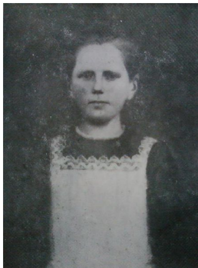
Karolina Kózkówna.