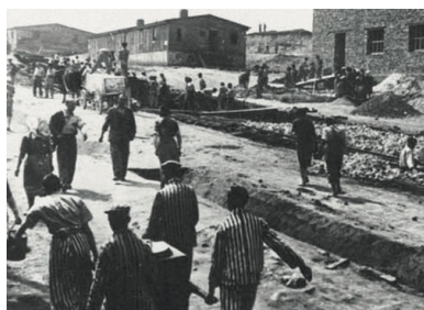
KL Płaszow bei Krakau - niemiecki nazistowski obóz pracy przymusowej w Płaszowie

Po czerwcowej deportacji Żydów zmniejszono obszar getta krakowskiego – 20 czerwca 1942 r. odcięto ulice Czarnieckiego, Rękawka, św. Benedykta, oraz południowe odcinki ul. Krakusa i Węgierskiej. Pozostali w dzielnicy mieszkańcy przystąpili do ponownego organizowania życia. Otwarte zostały te instytucje, z których wywieziono ludzi, jak np. szpitale czy ochronki dla dzieci. Nastąpił drugi okres adaptacji w żydowskiej dzielnicy mieszkaniowej.