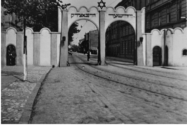
Jedna z bram krakowskiego getta (wejście z Rynku Podgórskiego na ul. Limanowskiego), 1941 r.

Rozporządzenia nie przynosiły spodziewanych efektów. Wyznaczone przez władze terminy na dobrowolny wyjazd z miasta nie dawały rezultatu, a co więcej, do stolicy GG przybywali Żydzi z innych miejscowości. Władze miejskie 25 listopada 1940 r. ponownie wydały zarządzenie o przesiedleniu Żydów z terenu Krakowa, podpisane przez gubernatora dystryktu krakowskiego, dr. Ottona Wächtera -