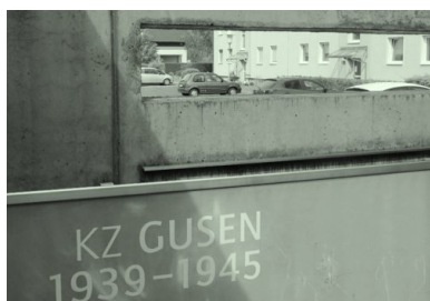
Widok przez mur obozu w Gusen