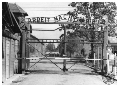
Brama główna KL Auschwitz, maj

wiele najpotężniejszych koncernów niemieckich.