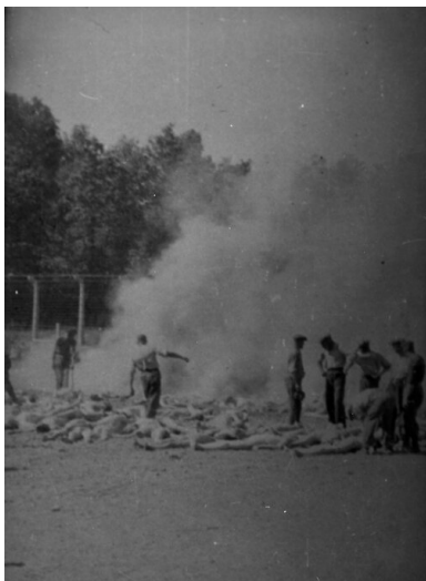
Palenie zwłok w KL Auschwitz.