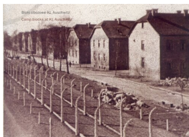
Bloki obozowe KL Auschwitz. Fot.

Pierwsza próba zrozumienia sytuacji przez Pileckiego: „Ach! Więc zamknęli nas w zakładzie dla obłąkanych!” przeradza się szybko w rzeczywistą ocenę stanu rzeczy. Każdego pytano po niemiecku, kim był w cywilu. „Odpowiedź: ksiądz, sędzia, adwokat powodowała bicie i śmierć. Przede mną w piątce stał jakiś kolega, który na to pytanie, rzucone mu z równoczesnym ujęciem go garścią za ubranie pod gardłem, odpowiedział: »Richter« [niem.: sędzia]. Fatalny pomysł! Po chwili był na ziemi bity i kopany”. Pilecki wreszcie zrozumiał: „Więc wykańczano specjalnie inteligencję. Po tym spostrzeżeniu zmieniłem nieco zdanie. To nie obłąkańcy, to jakieś potworne narzędzie do wymordowania Polaków, rozpoczynające swe dzieło od inteligencji”.