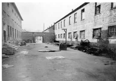
Mur ceglany na dziedzińcu bloku 11; po prawej przenośna szubienica, 1945 r.

Ci, dla których pracy zabrakło, byli zmuszani do „uprawiania gimnastyki”. „Niemożliwością było zrobić »żabkę« dookoła wielkiego placu – już nie dlatego, że w drewniakach, bo się je brało wtedy w ręce, i nie dlatego, że boso po żwirze zdierało się skórę ze stóp do krwi; lecz dlatego, że żadne mięśnie na taki wyczyn nie wystarczały. Tu znowu ratowała mnie zaprawa sportowa z lat przeszłych. Tu znowu wykańczano słabych inteligentów z brzuszkiem, dla których niemożliwa była żabka nawet na krótkiej przestrzeni. Tu znowu kij spadał na głowy tych, co się co parę kroków przewracali. Znowu niemiłosierne kończenie ludzi. I znowu, jak zwierzę, człowiek korzystał z chwili wytchnienia i łapał oddech w momencie, gdy zgraja z kijami obskakiwała jakąś nową ofiarę” – tyle Pilecki.