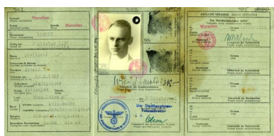
Kenkarta Witolda Pileckiego na nazwisko Smoliński.

Moment, w którym Pilecki mógł spokojnie opisać wszystko, co widział, nadszedł dopiero po wojnie, we Włoszech. Od 1943 r. żył w wirze spraw konspiracyjnych, służył w Kedywie, potem w Powstaniu Warszawskim dowodził jednym z oddziałów zgrupowania „Chrobry II” w tzw. Reducie Witolda. Z ruin stolicy wyszedł jako jeńiec, a do 2. Korpusu gen. Władysława Andersa dołączył w 1945 r. po wyzwoleniu przez Amerykanów z niemieckiego obozu w Murnau.