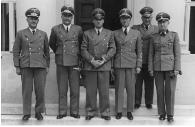
Generalny Gubernator Hans Frank w towarzystwie gubernatorów dystryktów - fotografia grupowa. Od lewej widoczni Ernst Kundt, Ludwig Fischer, Hans Frank, Otto Wachter, Ernst Zorner i Richard Wendler., październik 1942 r.

Zgodnie z przepisami na władzy okupacyjnej spoczywa obowiązek podjęcia wszelkich dostępnych środków w celu przywrócenia i zapewnienia porządku życia społecznego. Władza okupacyjna przejmuje nie tylko uprawnienia, ale i zobowiązania państwa okupowanego, działając w charakterze powiernika. Jest ona zobowiązana do poszanowania praw obowiązujących w danym kraju, a nawet przejęcia funkcji opiekuńczych (wypłacanie emerytur i świadczeń społecznych, utrzymanie i świadczenie opieki zdrowotnej).