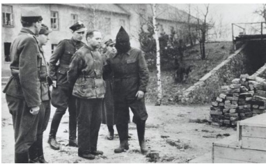
Egzekucja Rudolfa Hößa

„W odosobnieniu więziennym doszedłem do gorzkiego przeświadczenia, jak ciężko zgrzeszyłem przeciwko ludzkości. (...) Niechaj mi Bóg to moje postępowanie wybaczy. Proszę cały Naród Polski o przebaczenie”.