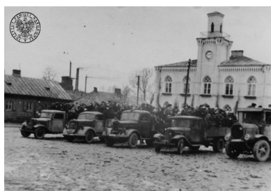
Ciechanowski ratusz (1942 r.), w okresie okupacji niemieckiej siedziba magistratu oraz miejsce