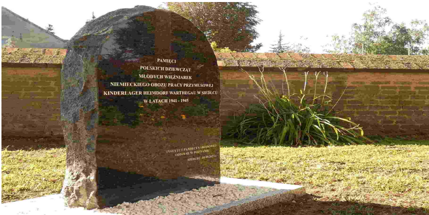
Pomnik poświęcony młodym więźniarkom

https://przystanekhistoria.pl/pa2/tematy/zbrodnie-niemieckie/105078,Wyrwane-z-rodzinnych-domow.html