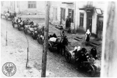
Dzieci Zamojszczyzny w sierocińcu w Łaskarzewie. Grudzień, 1942 r.

Pierwszy etap wysiedleń został przeprowadzony w okresie od listopada do grudnia 1942 r. i objął ok. 60 wsi zamieszkałych przez blisko 10 000 osób. Jego efekt nie był dla władz niemieckich zbyt zadowalający, gdyż miejscowa ludność uciekała do lasu wraz z całym dobytkiem.