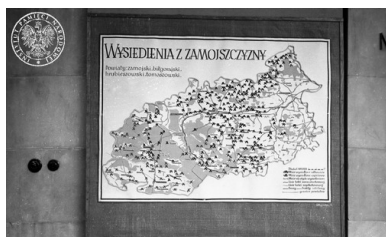
Tablica z mapą „Wysiedlenia z Zamojszczyzny” wisząca na

W nocy z 27 na 28 listopada 1942 r. rozpoczęła się akcja wysiedleńcza ludności polskiej, która objęła cztery powiaty: biłgorajski, hrubieszowski, tomaszowski i zamojski. Została ona przeprowadzona, w sposób bardzo brutalny, przez niemieckie oddziały policyjne Schutzpolizei ( Schupo ), żandarmerii i policji pomocniczej. Siły policyjne otaczały wysiedlaną wieś szczelnym kordonem, dając jej mieszkańcom jedną godzinę na zabranie bagażu podręcznego, nakazując jednocześnie pozostawienie na miejscu całego mienia ruchomego, nieruchomego i inwentarza żywego.