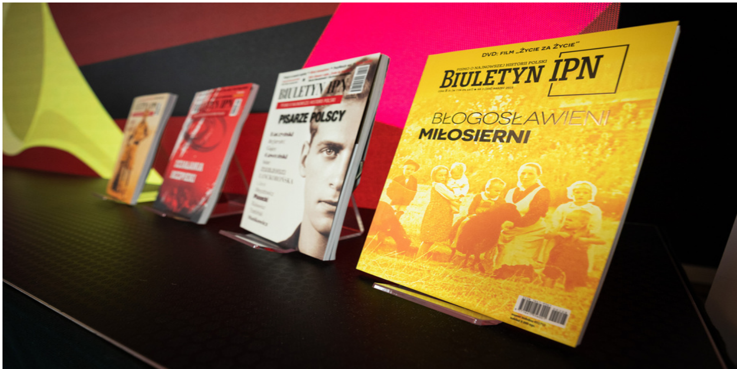
„Biuletyn IPN” 3/2023

https://przystanekhistoria.pl/pa2/tematy/zbrodnie-komunistyczne/99825,Emanuel-Prokesch-vel-Jan-Baranowski-Przyczynek-do-dziejow-konspiracji-wilenskiej.html