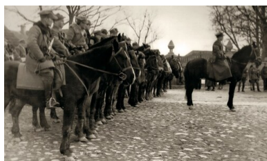
Żołnierze 3. Wileńskiej Brygady AK w Turgielach, 9 IV 1944 r.