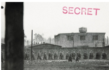
Wymarsz więźniów do pracy w niemieckim obozie w Jaworznie

W obozie świętochłowskim miejscem szczególnych represji był barak nr 7 7 , w którym przebywali m.in. oskarżeni o członkostwo w NSDAP. Więźniowie byli bici (m.in. nogami od stołu), zmuszani do wielogodzinnego biegania, stójek karnych z cegłami na głowie, osadzani w karczerze wypełnionej wodą oraz karani tzw. ukraińskimi procesjami 8 . Niektórzy więźniowie próbowali uciekać, zdarzały się też przypadki samobójstw, gwałtów i morderstw. W obozie w Jaworznie zmarło ponad 6 tys. osób.