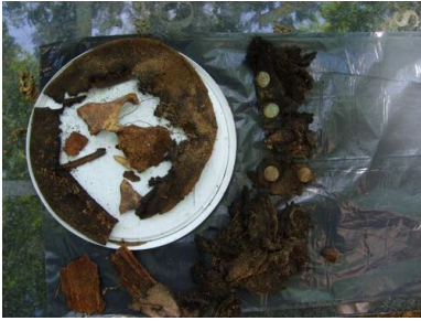
Szczątki munduru wydobyte podczas ekshumacji na Cmentarzu Osobowickim we Wrocławiu, 2008 r.

naczelnika więzienia, lekarza i duchownego. Określono również co należy zrobić w przypadku, gdy po oddaniu salwy lekarz stwierdziłby, że skazaniec wciąż żyje. W takiej sytuacji przepisy przewidywały, że dowódca plutonu jest obowiązany do oddania strzału z broni krótkiej w skroń skazańca 27 . Obecnie wiemy, że omawiane przepisy były lekceważone i osoby, odpowiedzialne za przeprowadzane egzekucje na więźniach w polskich więzieniach w latach stalinizmu, nie respektowały ich.