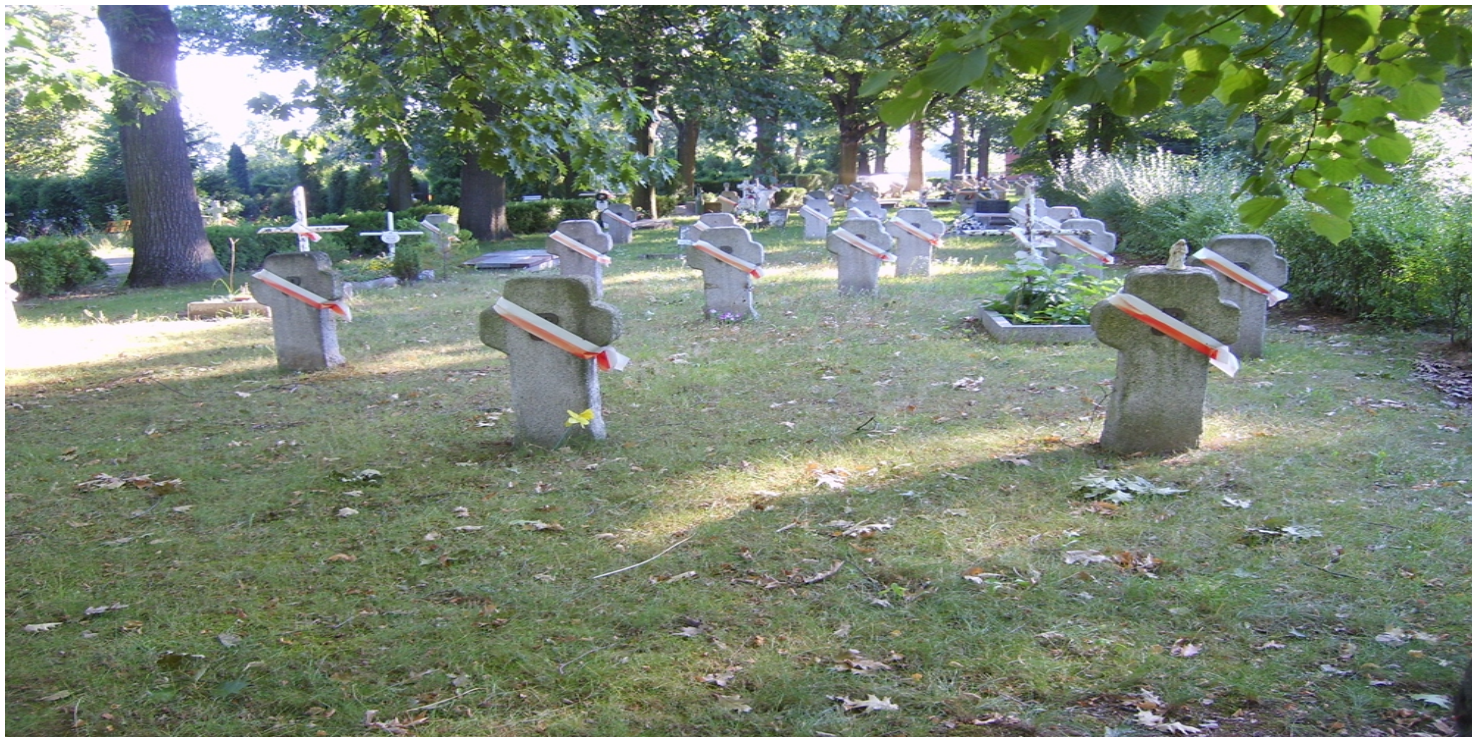
Cmentarz Osobowicki we Wrocławiu, 2008 r.

https://przystanekhistoria.pl/pa2/tematy/zbrodnie-komunistyczne/92498,Stefan-Polrul-marynarz-ktory-mial-nigdy-nie-wrocic-do-domu.html