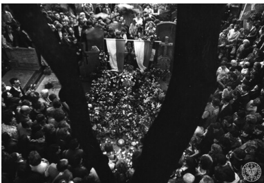
Pogrzeb Grzegorza Przemyska w