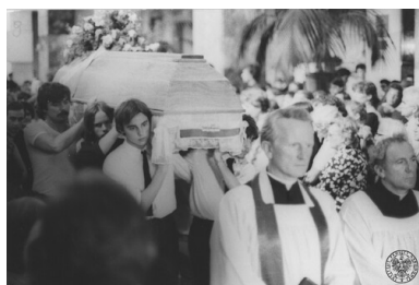
Pogrzeb Grzegorza Przemyka.