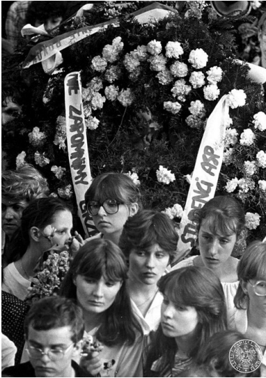
Pogrzeb Grzegorza Przemka w Warszawie, 19 maja 1983 r. Młodzież w kondukcje żałobnym. W głębi wieniec od studentów Akademii Sztuk Pięknych.