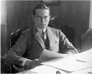
Zdjęcie portretowe prezydenta Apolinarego Jankowskiego