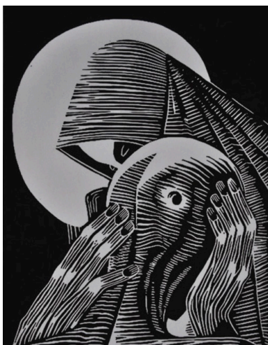
Matka Boża Katyńska - linoryt autorstwa Danuty Staszewskiej