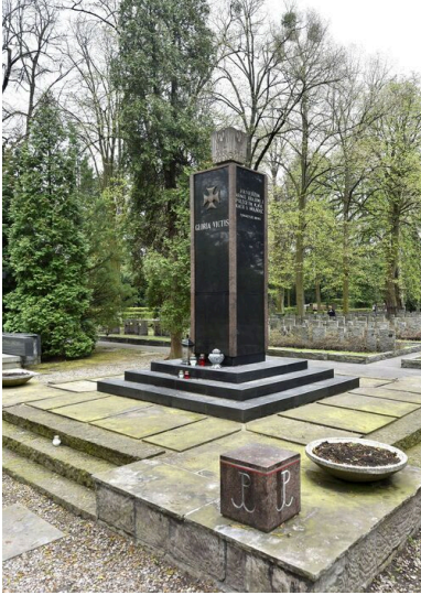
Pomnik „Gloria Victis”

Pamięć Katynia i pamięć Powstania Warszawskiego, także pamięć AK po wojnie splotały się. Było to efektem presji oficjalnej propagandy, prowadzonej w sposób cyniczny i kłamliwy, wrzucającej oba tragiczne wydarzenia do wspólnego worka, poddanego napiętnowaniu. Ton nadawały teksty działaczy partyjnych, jak ten Zenona Kliszki zamieszczony pod pseudonimem w „Odrodzeniu” wkrótce po kapitulacji powstania: