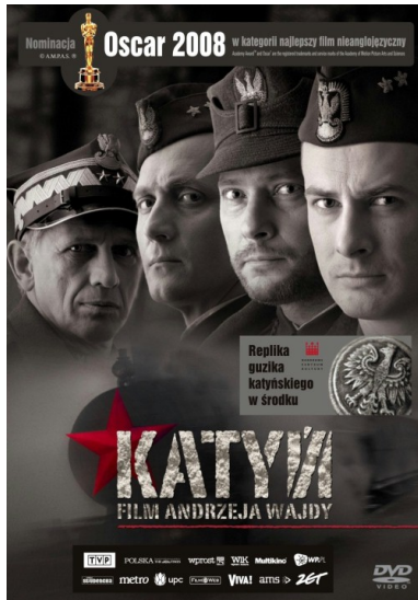
Plakat filmu "Katyń" w reżyserii Andrzeja Wajdy