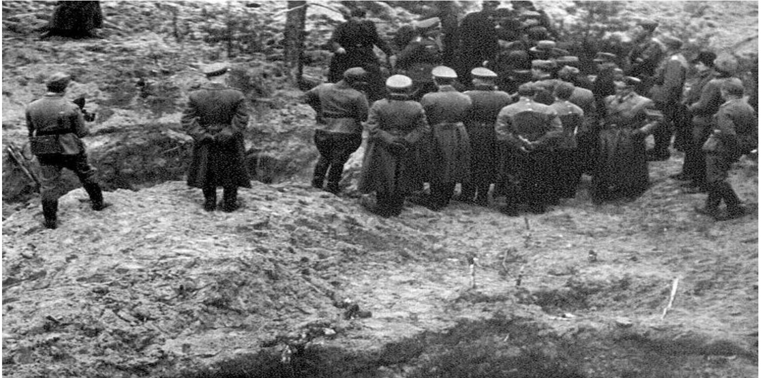
Szczałki odnalezione w Katyniu

https://przystanekhistoria.pl/pa2/tematy/zbrodnie-katynska/77789,Niemcy-w-Katyniu-w-1943-roku.html