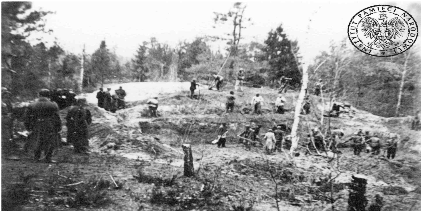
Pierwsza ekshumacja oficerów WP zamordowanych przez NKWD w Katyniu. Katyń, 16 IV 1943 r.