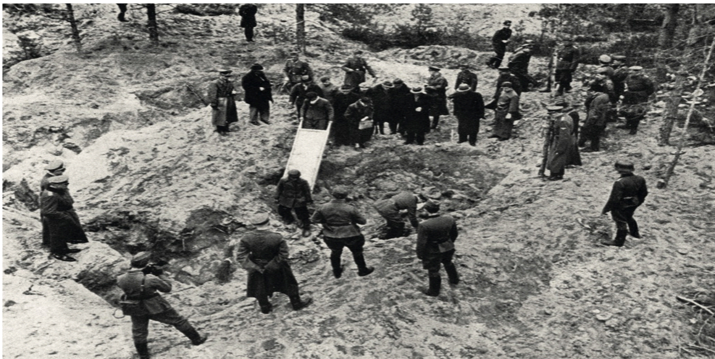
Ekshumacja zwłok z jednego ze zbiorowych grobów polskich ofiar w Lesie Katyńskim, kwiecień 1943 r.

https://przystanekhistoria.pl/pa2/tematy/zbrodni-katynska/100638,Odkrycie-zbrodni-w-Lesie-Katynskim.html