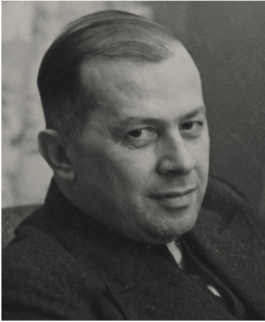
Ferdynand Goetel, 1936 r.