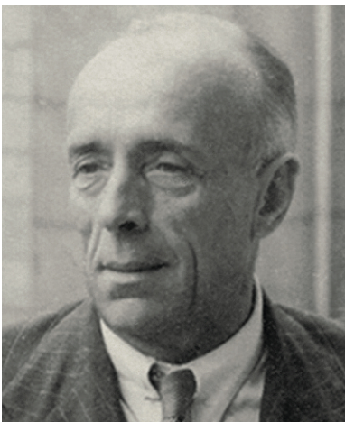
Kazimierz Skarżyński