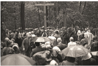
Msza św. 10 sierpnia 1991 r. wraz z pochówkiem polskich oficerów ekshumowanych w Charkowie-Piatichatkach.

„zrobiło się ciemno jak w nocy, ludzie nie wiedzieli, co się dzieje, konary fruwały. I pamiętam, jak ktoś nagle powiedział: »To tak jakby Pan Bóg zapłakał«”.