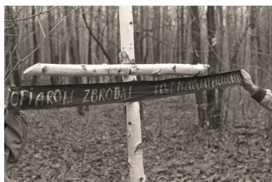
Brzozowy krzyż postawiony przez pracowników Energopolu 1 listopada 1990 r. przy dołach śmierci w Charkowie-Piatichatkach.

Jesienią 1990 r. na terenie bazy firmy Energopol w Kotelwie niedaleko Połtawy rozeszła się wiadomość o miejscach, w których mogły się znajdować zwłoki polskich oficerów. Pięćdziesięciu pracowników Energopolu zorganizowało 1 listopada 1990 r. wyprawę autobusem na tereny potencjalnej zbrodni w Charkowie.