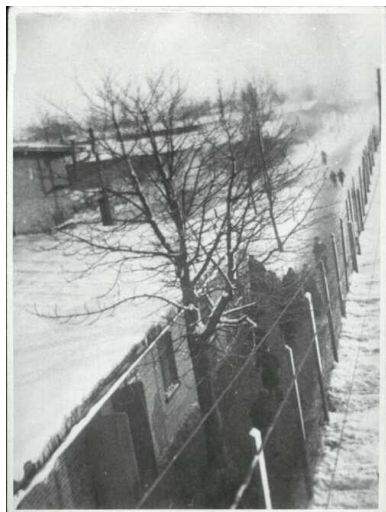
Ogrodzenie obozu

Cały dotychczasowy majątek miał stać się własnością nowych niemieckich mieszkańców Kraju Warty. Część osób od razu wywożono koleją do Generalnego Gubernatorstwa, pozostałych umieszczano w specjalnie tworzonych obozach przejściowych.