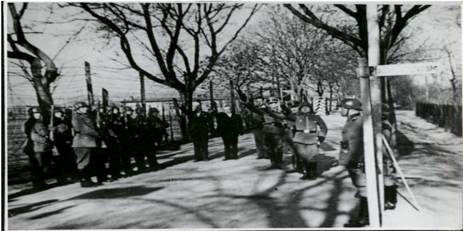
Obchody święta 1 Maja przez załogę niemieckiego obozu przy ul. Głównej (fot. z zasobu IPN)

https://przystanekhistoria.pl/pa2/tematy/wysiedlenia/103441,Lager-Glowna-1939-1940.html