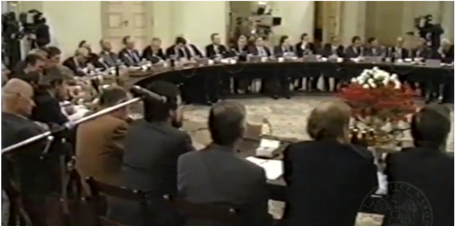
Kadr z kroniki filmowej

https://przystanekhistoria.pl/pa2/tematy/wybory-czerwcowe/99895,Okragly-stol.html