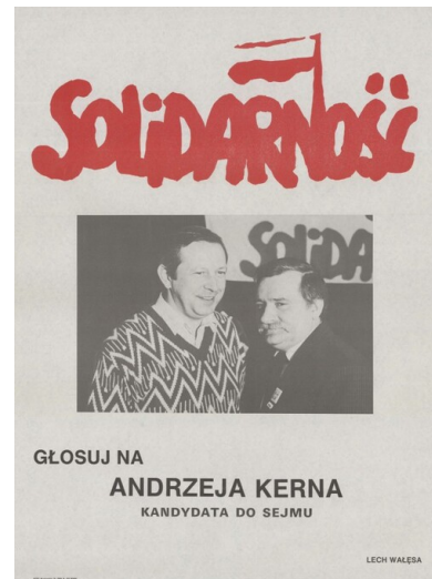
Plakat wyborczy Andrzeja Kerna