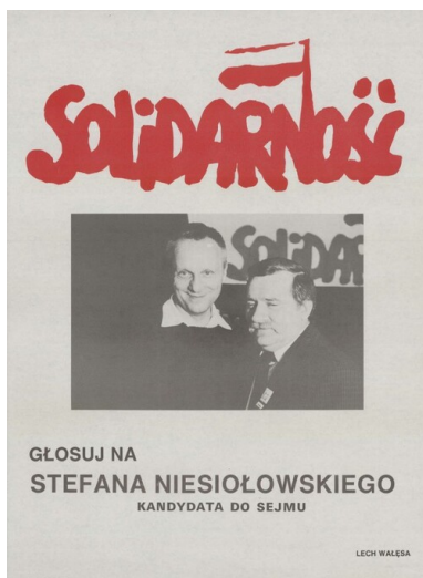
Plakat wyborczy Stefana Niesiołowskiego