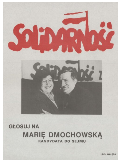
Plakat wyborczy Marii Dmochowskiej