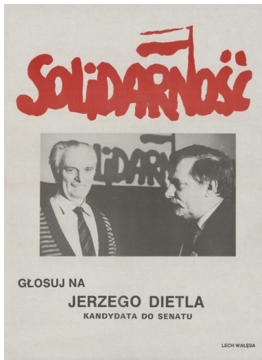
Plakat wyborczy Jerzego Dietla