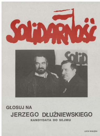
Plakat wyborczy Jerzego Dłużniewskiego