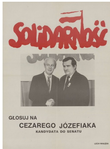
Plakat wyborczy Cezarego Józefiaka