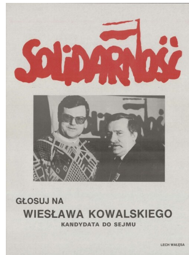
Plakat wyborczy Wiesława Kowalskiego