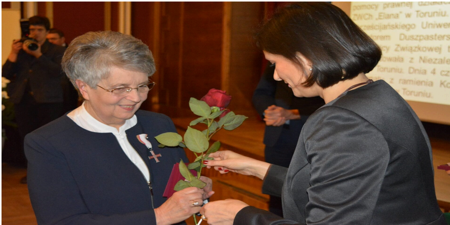
Zorganizowana przez IPN uroczystość wręczenia Krzyży Wolności i Solidarności, Bydgoszcz, 20 III 2017 r.

https://przystanekhistoria.pl/pa2/tematy/wybory-czerwcowe/104731,Zeby-prawo-chronilo-czlowieka-Alicja-Grzeskowiak-zasluzona-dzialaczka-torunskiej.html