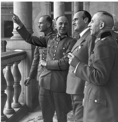
Niemieccy generałowie z wizytą u okupacyjnego gubernatora Hansa Franka na Wawelu.

Władze w Warszawie nie były zbyt zadowolone, że wydano 2500 zł, ale jak się wkrótce okazało, bez tych przygotowań, szybka ewakuacja skarbów nie byłaby możliwa. Wawelskie precjoza podzieliłyby zapewne los wielu innych pamiątek i skarbów narodowych zagrabionych przez okupantów.