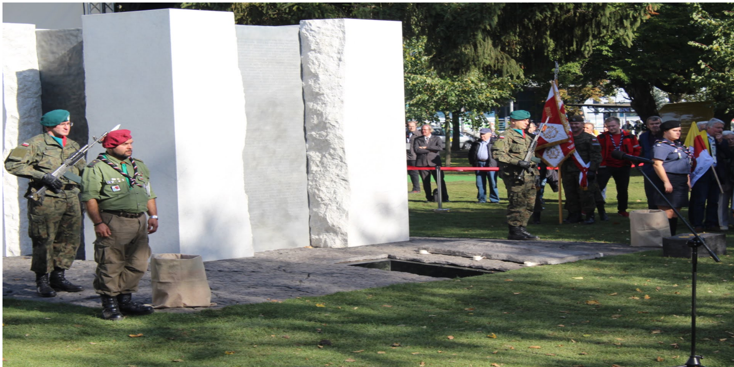
Uroczyste odsłonięcie Pomnika Ofiar Zbrodni Pomorskiej 1939 - Toruń, 6 X 2018 r.

https://przystanekhistoria.pl/pa2/tematy/wrzesien-1939/94808,Ksieze-Gory.html