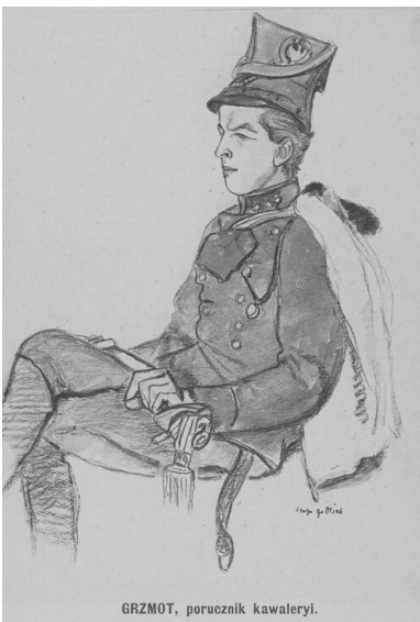
GRZMOT, porucznik kawalerii.