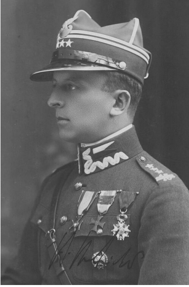
Gen. Stanisław Grzmot-Skotnicki

Tekst pochodzi z serii Małopolscy Bohaterowie Września 1939