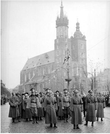
Stanisław Grzmot-Skotnicki na czele konduktu pogrzebowego Władysława Beliny- Prażmowskiego.