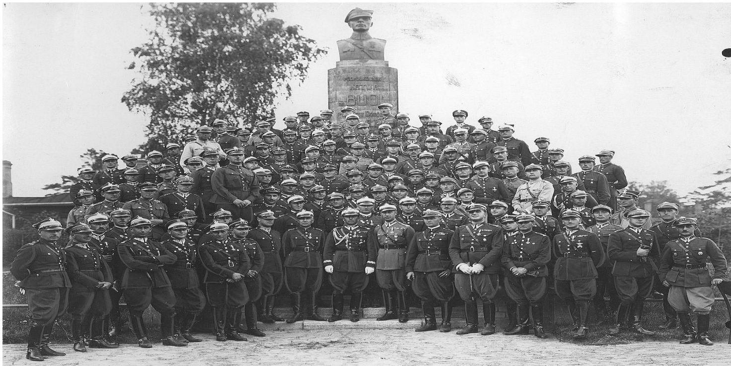
1933 r. Zawody jeździeckie o mistrzostwo armii w Baranowiczach. W środku w pierwszym rzędzie gen. Grzmot-Skotnicki.

https://przystanekhistoria.pl/pa2/tematy/wrzesien-1939/103171,Stanislaw-Grzmot-Skotnicki-1894-1939.html