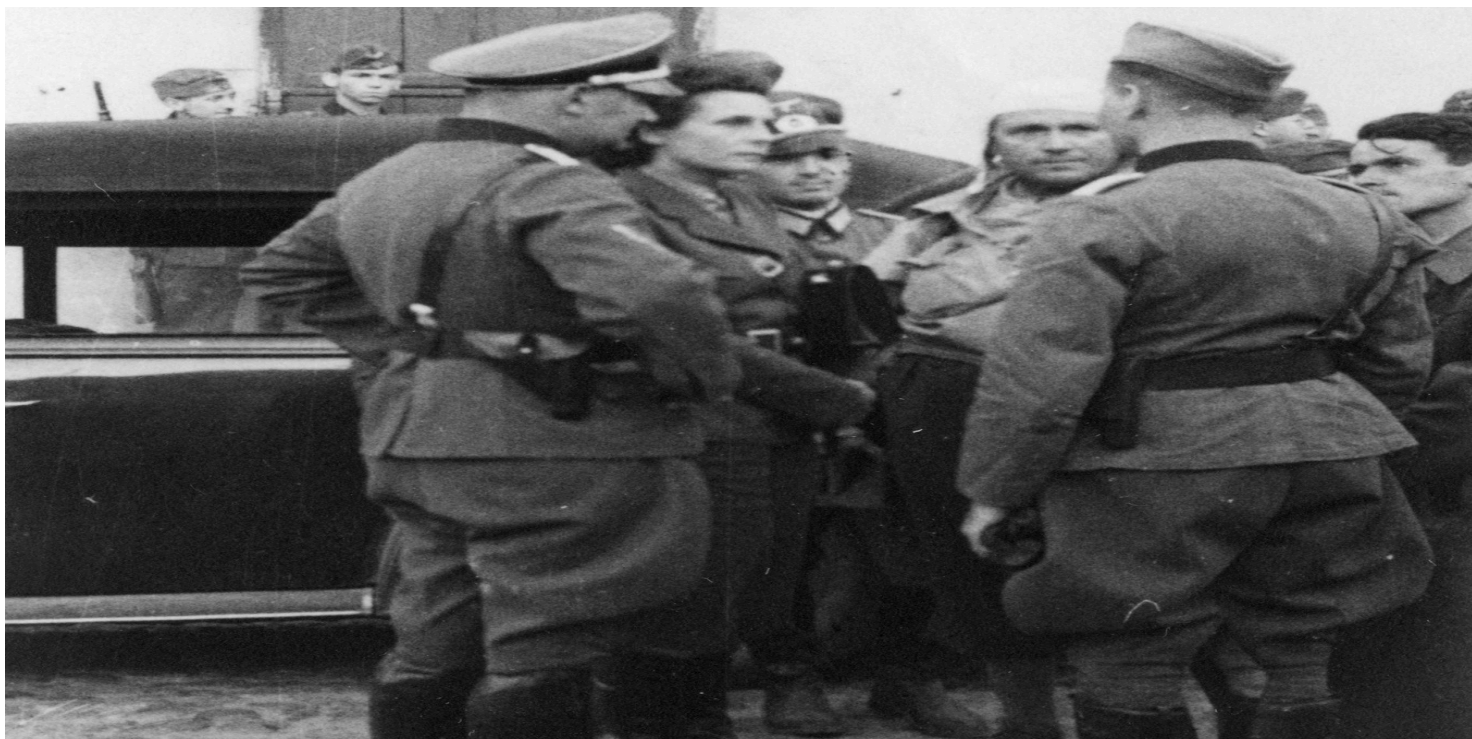
Leni Riefenstahl i towarzyszący jej członkowie ekipy rozmawiają z niemieckimi oficerami, prawdopodobnie po przybyciu do miasta. Końskie, 12 IX 1939 r.

https://przystanekhistoria.pl/pa2/tematy/wrzesien-1939/101253,Romans-kina-i-swastyki.html