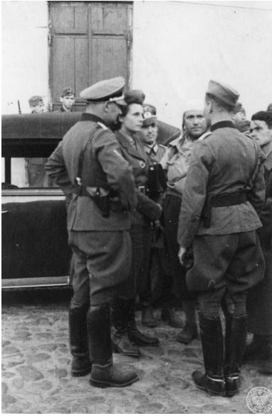
Leni Riefenstahl i towarzyszący jej członkowie ekipy rozmawiają z niemieckimi oficerami, prawdopodobnie po przybyciu do miasta. Końskie, 12 IX 1939 r.