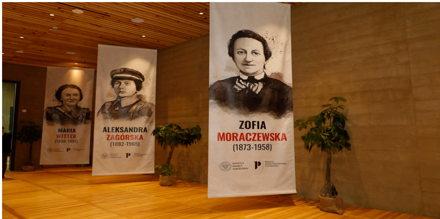
Sylwetki m.in. Marii Wittek i Aleksandry Zagórskiej na banerach towarzyszących finałowi konkursu „NiezwyciężONE. Bohaterki Niepodległej” – Sulejówek, 2022.

https://przystanekhistoria.pl/pa2/tematy/wojna-polsko-bolszewick/99427,Ochotnicza-Legia-Kobiet-Amazonki-w-wojsku-Rzeczpospolitej.html