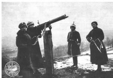
Żołnierki z Ochotniczej Legii Kobiet przy karabinie przeciwlotniczym na Wysokim Zamku. Lwów, 1919-1920 r.

„Zwalnianie z wojska legionistek było najcięższym dla nich zawodem życiowym. Niektóre z nich zostały bez środków do życia i w miesiącach zimowych bez dachu nad głową. Odchodziły w poczuciu wielkiej krzywdy, którą, jak uważały, uczyniło im wojsko, któremu oddane były bez reszty...”.