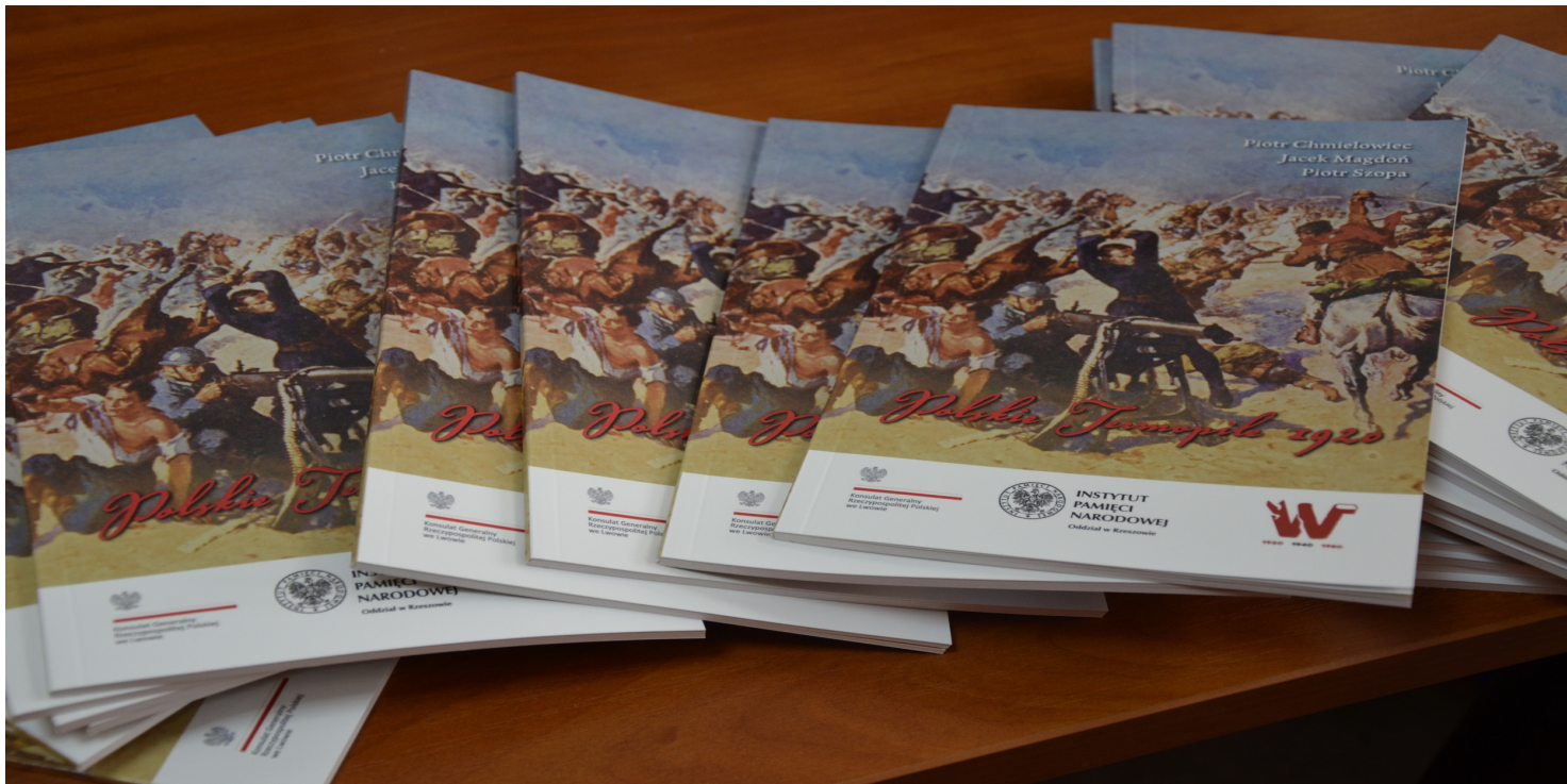
„Polskie Termopile 1920” - publikacja IPN Rzeszów na 100- lecie zwycięstwa nad bolszewikami

https://przystanekhistoria.pl/pa2/tematy/wojna-polsko-bolszewick/87655,Firlejowka-wrzesniowy-boj-1920-roku.html