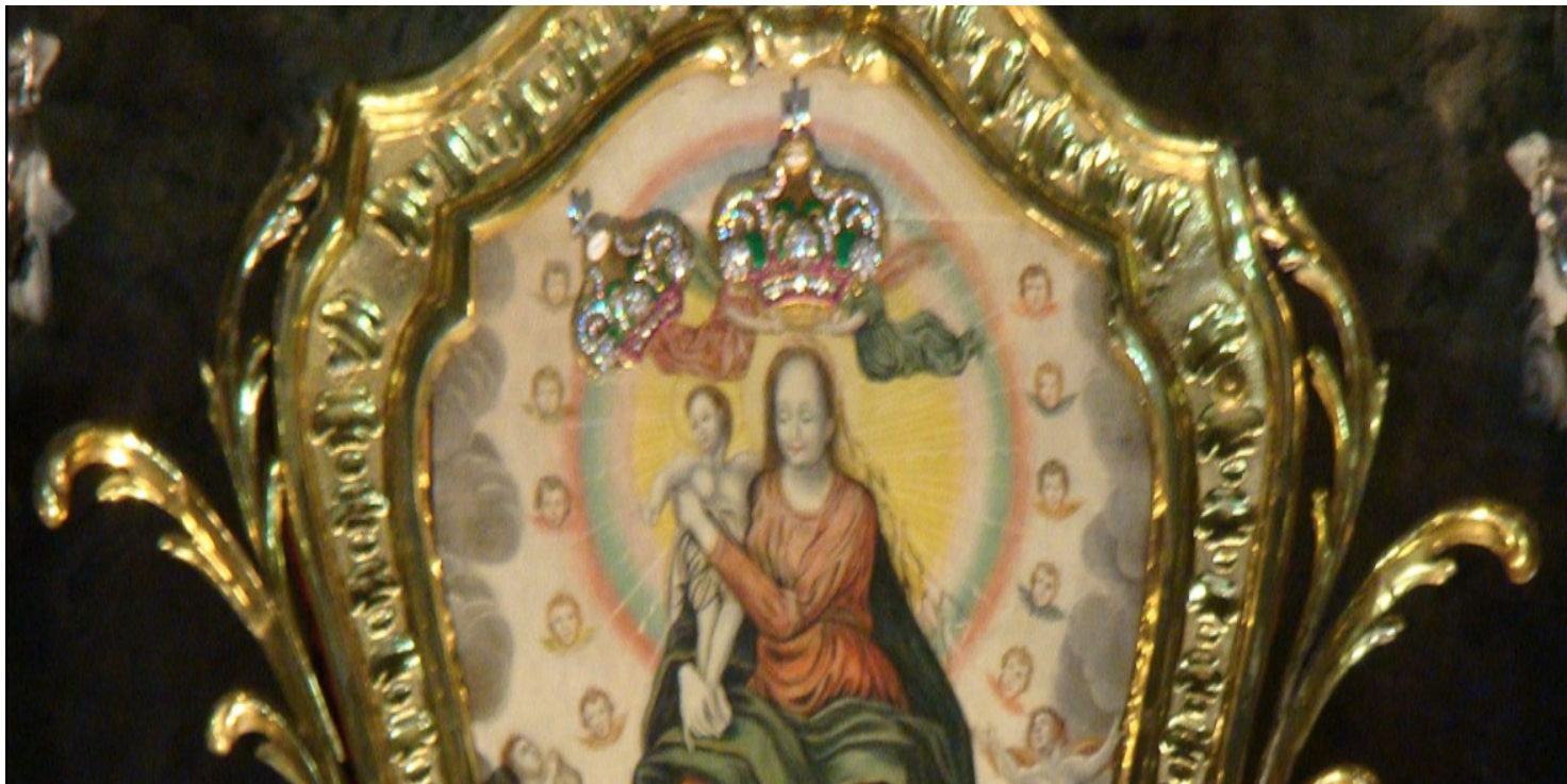
Kopia obrazu Matki Bożej Łaskawej w katedrze we Lwowie

https://przystanekhistoria.pl/pa2/tematy/wojna-polsko-bolszewick/85484,Arcybiskup-lwowski-jozef-bilczewski-wobec-inwazji-bolszewickiej-1920-roku.html