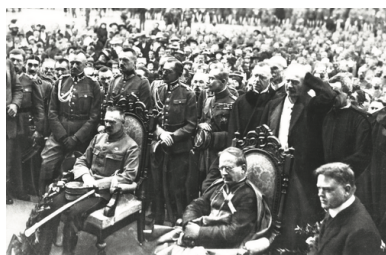
Uroczysta msza św. na pl. Saskim w Warszawie. Siedzą od lewej: marszałek Józef Piłsudski, nuncjusz apostolski Achille Ratti oraz Herbert Hoover - szef misji pomocy dla ofiar I wojny światowej, 13VIII 1919 r.

Równocześnie abp Bilczewski niemal od samego początku konfliktu z bolszewikami żywo interesował się rozwojem sytuacji na froncie, a istotnym źródłem wiedzy były dla niego spotkania z dostojnikami kościelnymi i politykami, na przykład w sierpniu 1919 r. w Warszawie z Józefem Piłsudskim. Informacje te pozostawały jednak w tle spraw najbardziej pilnych oraz interesujących hierarchę, czyli pomocy materialnej dla Małopolski Wschodniej i statusu politycznego regionu po zakończonej zwycięskiej wojnie ukraińsko-polskiej z lat 1918–1919.