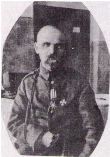
Gen. Mychajło Omelanowycz-Pawłenko

25 kwietnia połączone siły polsko-ukraińskie (60 tys. żołnierzy polskich i 5 tys. ukraińskich płk. Udowyczenki) rozpoczęły ofensywę. W ciągu tygodnia wyparły one bolszewików z Żytomierza, Berdyczowa, Winnicy i 6 maja wkroczyły do Kijowa. Za Polakami do Kijowa przybyła ukraińska 6. Dywizja Strzelców. Rankiem 9 maja na Chreszczatyku odbyła się parada wojsk polskich i ukraińskich na cześć wyzwolenia stolicy Ukrainy.