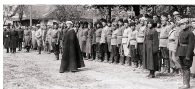
Symon Petlura (z lewej) dokonuje przeglądu oddziału Armii Czynnej URL, przed frontem oddziału gen. Iwan Omelanowycz-Pawłenko, Kijów, maj 1920 r.

Jednocześnie w Kamieńcu Podolskim, zajęтым przez polskie wojska, rozpoczęto formowanie 4. Brygady Strzelców, a na terenie „niczyich” powiatów mohylowskiego i jampolskiego – Samodzielnej Brygady Strzelców. Jednostki te 20 marca połączono w 2. Dywizję Strzelców pod dowództwem płk. Ołeksandra Udowyczenki. Także w tym przypadku Polacy wzięli na siebie zapewnienie potrzebnego sprzętu wojskowego.