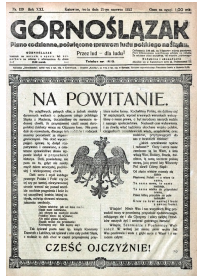
Strona tytułowa „Górnoślązaka” z informacją o wkroczeniu wojsk polskich do części Górnego Śląska, przejętej przez władze polskie, 21 czerwca 1922 r.