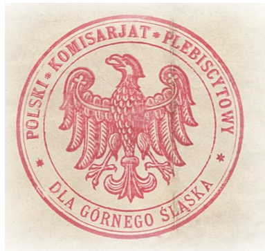
Pieczęć Polskiego Komisariatu Plebiscytowego