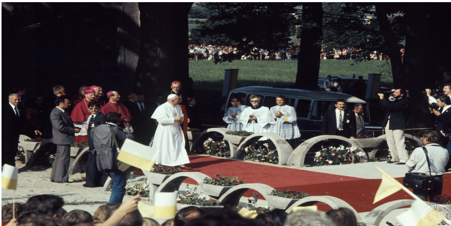
Jan Paweł II przed rozpoczęciem nieszporów maryjnych na Górze Świętej Anny, 21 VI 1983 r.

https://przystanekhistoria.pl/pa2/tematy/wojciech-jaruzelski/102445,Przywrocenie-nadziei.html