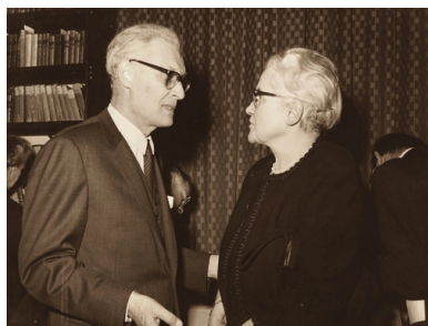
Kazimierz Wierzyński i Karolina Lanckorońska w Bibliotece Polskiej w Londynie, 1969 r.

Poglądy filozoficzne Lanckorońskiej wyrastały nie tylko z ogromnej wiedzy, lecz przede wszystkim z długich i zróżnicowanych doświadczeń życiowych. Pamiętała czasy sprzed I wojny światowej, a cesarza Franciszka Józefa oraz ministrów monarchii austro-węgierskiej poznała osobiście. Ze światem nowoczesnym zaznajomiła się jeszcze wszechstronniej – od salonów arystokratycznych i auli uniwersyteckich po przesłuchania NKWD i gestapo oraz pobyty w więzieniach i obozie koncentracyjnym; aktywnie przetrwała epokę zniewolenia jej rodzinnej Europy i dwukrotnie doczekała niepodległości Polski. Jej doświadczenia w przestrzeni geograficznej i kulturowej też są imponujące. Bardzo dobrze znała zachodnią Europę, długo żyła w państwach demokratycznych, ale dane jej było również zaznać rozmaitych form istnienia w ustrojach totalitarnych: rosyjskiego komunizmu i niemieckiego narodowego socjalizmu.