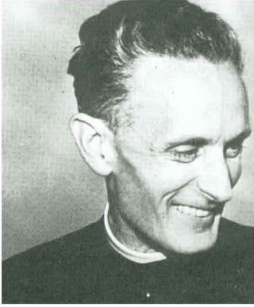
Ks. Carlo Gnocchi (1902-1956)