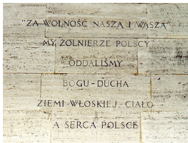
Sentencja na pomniku 3 Dywizji Strzelców Karpackich na szczycie wzgórza 593, sierpień 1981 r.