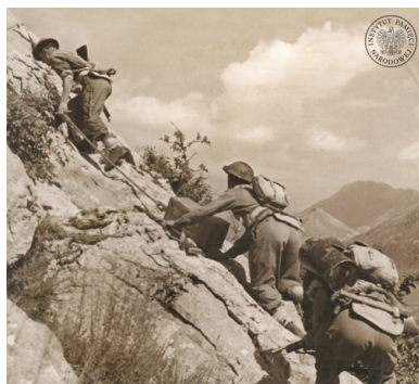
Żołnierze 2 Korpusu Polskiego zaopatrują walczące oddziały wspinając się na szczyt z pakunkami, Monte Cassino, maj 1944 r.