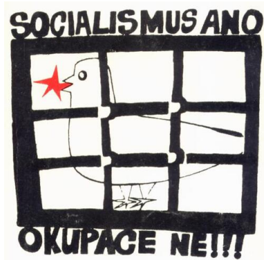
Plakat z okresu aksamitnej rewolucji

sojalizmu” przez wrogie mu siły wewnętrzne lub zewnętrzne.