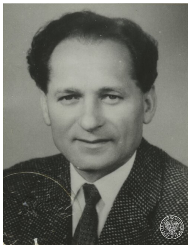
Mieczysław Moczar, Szef WUBP w Łodzi w latach 1945-1948.

Podczas gdy „partyzanci” swobodnie poszerzali swoje wpływy, na taką wyrozumiałość ze strony ekipy Gomułki nie mogły liczyć inne nurty w PZPR. W połowie 1963 r. z wysokich stanowisk partyjnych zrezygnował Roman Zambrowski, uznawany za przywódcę grupy „puławskiej”. Świadczyło to nie tylko o wzmagających się rządach silnej ręki, ale także o ostatecznej rozprawie z niedobitkami reformatorskiej grupy „puławian”. Kurs ten potwierdziło obradujące w tym czasie XIII Plenum KC PZPR, poświęcone sprawom ideologicznym. Uznaje się je za symboliczny, ostateczny kres procesu liberalizacji systemu w epoce Gomułki.