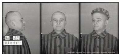
Witold Pilecki w 1940 r. jako więzień KL Auschwitz.