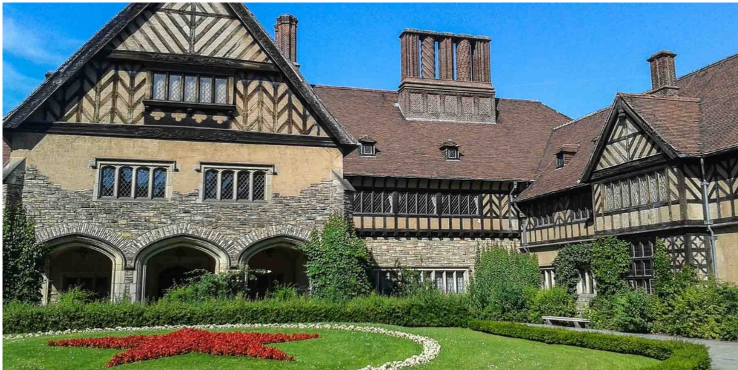
Pałac Cecilienhof w Poczdamie

https://przystanekhistoria.pl/pa2/tematy/wielka-brytania/85009,Konferencja-w-Poczdamie-Ostatnie-spotkanie-Wielkiej-Trojki.html