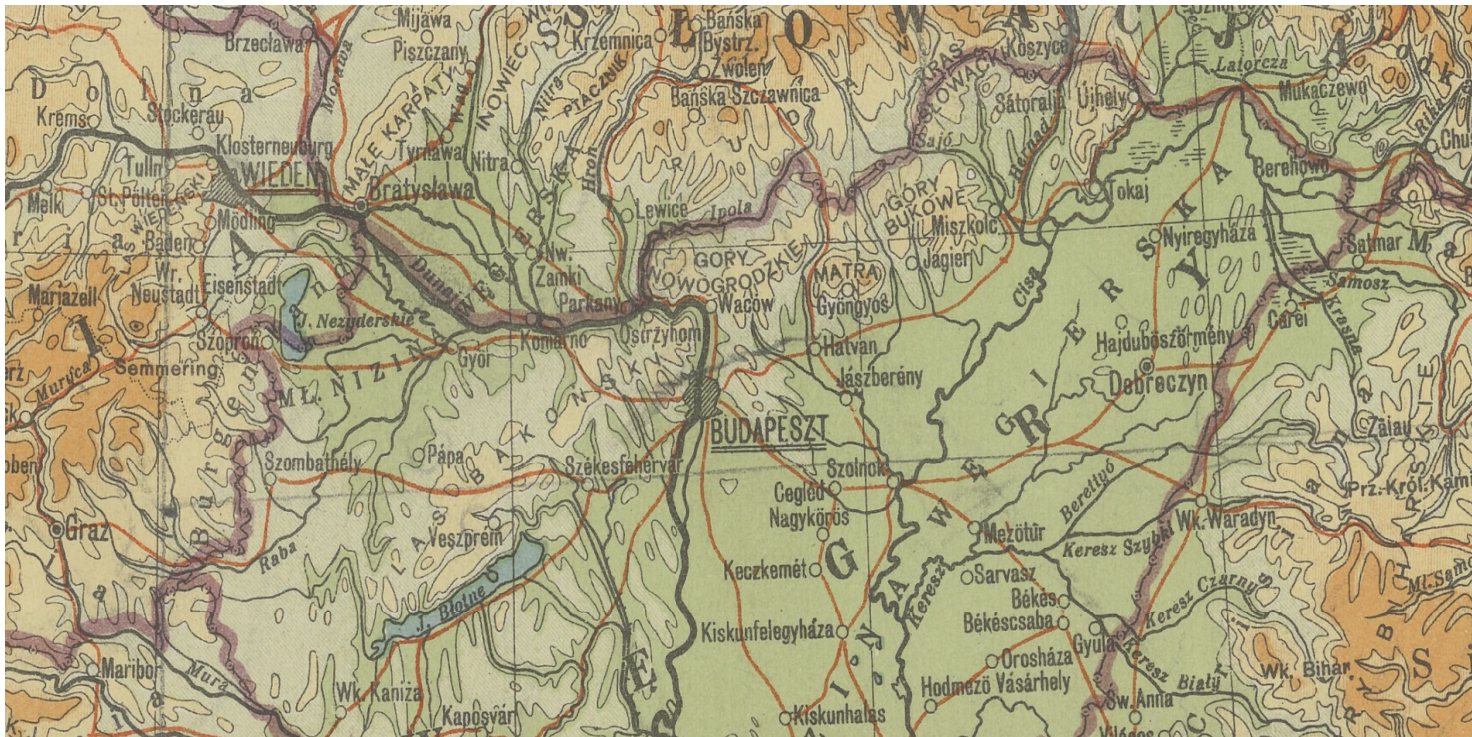
Vác (dawniej pol. Waców) położony na północ od Budapesztu (E. Romer, Powszechny Atlas Geograficzny, 1934)

https://przystanekhistoria.pl/pa2/tematy/wegry/98023,Sierociniec-w-Vcu.html