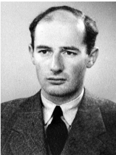
Zdjęcie paszportowe Raoula Wallenberga z 1944 r. (domena publiczna)