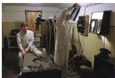
Rekonstrukcja gabinetu lekarskiego w Muzeum Szpitala w Skale.