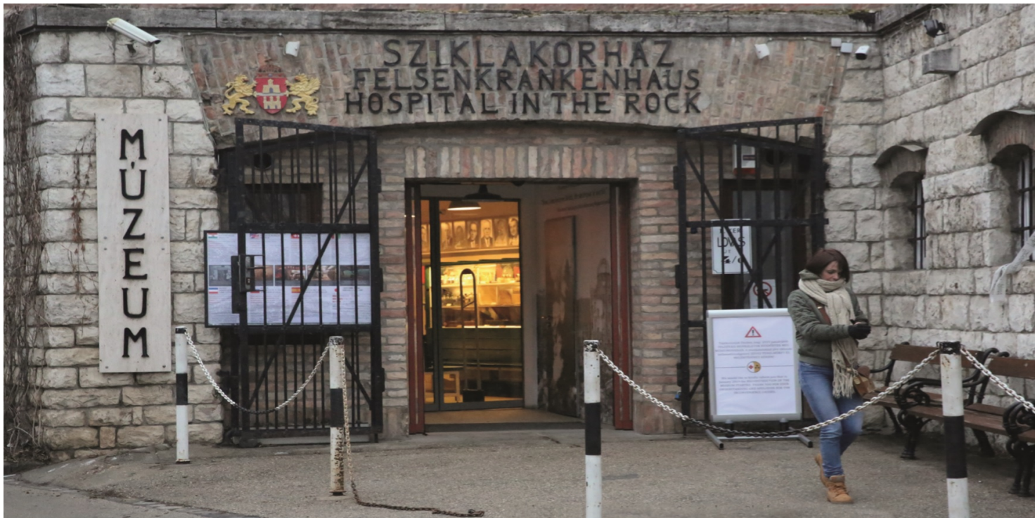
Budapeszteńskie Muzeum Szpitala w Skale.

https://przystanekhistoria.pl/pa2/tematy/wegry/95425,Szpital-w-skale-Budapeszt-w-czasie-wojny-i-rewolucji-1956-roku.html