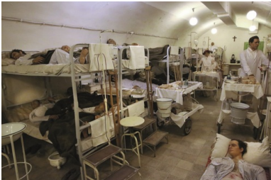
Rekonstrukcja sali dla chorych w Muzeum Szpitala w Skale.

Bogárdi został później lekarzem i pracował w tym samym szpitalu podczas węgierskiej rewolucji 1956 r.