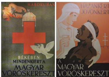
Plakaty z walczącego Budapesztu, 1956 r. (zbiory Muzeum Szpitala w Skale).

W 1945 r. na Węgrzech niemiecką okupację zastąpiła sowiecka, a prawicową dyktaturę szybko zamieniono na reżim komunistyczny. Po pięciu latach pobytu w Związku Sowieckim wrócił z Armią Czerwoną Mátyás Rákosi (właśc. Rosenfeld), stary komunista, członek rządu Węgierskiej Republiki Rad Béli Kuna. Rákosi – „najlepszy uczeń Stalina” – był odpowiedzialny za pozbawianie mieszkańców kraju swobód obywatelskich i masowe represje wobec przeciwników politycznych. Pod naciskiem przywódcy ZSRS Nikity Chruszczowa 18 lipca 1956 r. został wymieniony na Ernő Gerő, który podczas wojny domowej w Hiszpanii otrzymał przydomek „rzeźnik z Barcelony”. „Wybór” tego okrutnego dyktatora był jednym z powodów wybuchu rewolucji 1956 r. To właśnie Gerő poprosił Chruszczowa o interwencję militarną.