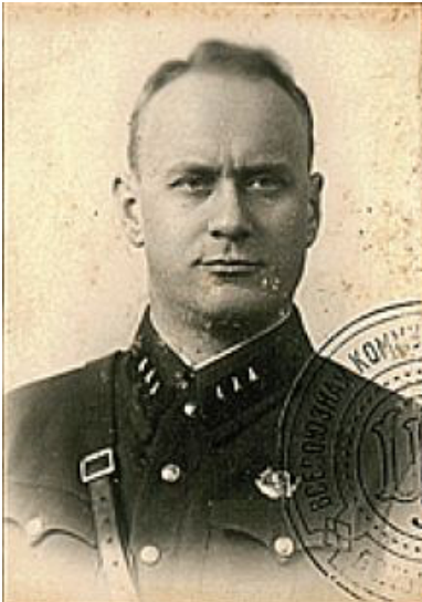
Iwan Sierow.

Gw. Dywizji Zmechanizowanej, które po południu dotarły do miasta. Obsadziły one dzielnice w Budzie oraz mosty na Dunaju. Do wieczora w Budapeszcie skoncentrowano 6 tys. żołnierzy sowieckich, 290 czołgów, 120 transporterów opancerzonych i 156 dział 4 .