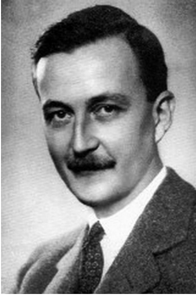
János Esterházy (1901-1957). Fot.