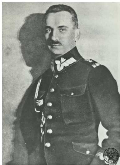
Gen. Kazimierz Sosnkowski, którego János Esterházy osobiście przewiózł do Budapesztu na węgierskim etapie przedstawiania się generała do Francji po klęsce Polski w wojnie obronnej 1939 r.

W nowo powstałym państwie słowackim Esterházy dalej był posłem do parlamentu. Od razu przystąpił też do konkretnych działań, by pomóc swym rodakom znajdującym się w trudnej sytuacji bytowej. Główną jego inicjatywą był program o nazwie Dom Węgierski. Organizowano zbiórki pieniędzy na wybudowanie na Słowacji ośrodków dla węgierskich partii politycznych, stowarzyszeń kulturalnych, księgarń, świetlic, sal teatralnych i kinowych oraz ciepłych izb dla biednych. Esterházy rozpoczął również wydawanie gazety „Új Hírek” („Nowe Wiadomości”). Choć na jej łamach apelował o pokojowe współżycie Słowaków i Węgrów, to tytuł był wielokrotnie zawieszany, cenzurowany, a poszczególne numery konfiskowano.