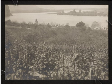
Devín (dziś dzielnica Bratysławy), miejsce, gdzie Morawa wpada do Dunaju; przed 1939. Ze zbiorów cyfrowych Biblioteki Narodowej (polona.pl)

Został aresztowany przez funkcjonariuszy bezpieki i wkrótce, bez poinformowania o tym rodziny, wraz z dziesięcioma innymi Węgrami wywieziony do Moskwy. Tam w sfigowanym procesie – za rzekome wspieranie faszystów i przypisywanie Sowiecom Zbrodni Katyńskiej – skazano go na dziesięć lat ciężkich robót.